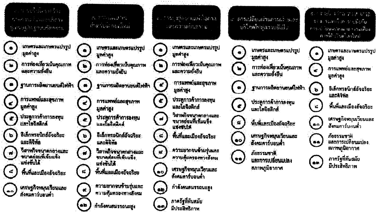
แผนภาพที่ ๓.๑ ความเชื่อมโยงระหว่างหมวดหมู่การพัฒนา กับเป้าหมายหลัก

ความเชื่อมโยงระหว่างหมวดหมู่การพัฒนา กับเป้าหมายหลักแสดงไว้ในแผนภาพที่ ๓.๑ โดยหมวดหมู่การพัฒนาที่กำหนดขึ้นเป็นประเด็นที่มีลักษณะเชิงบูรณาการที่ครอบคลุมการพัฒนาตั้งแต่ในระดับต้นน้ำจนถึงปลายน้ำ และสามารถนำไปสู่ผลพัฒนาทั้งในมิติเศรษฐกิจ สังคม ทรัพยากรธรรมชาติและสิ่งแวดล้อมไปพร้อมๆ กัน ทำให้หมวดหมู่แต่ละประการสามารถสนับสนุนเป้าหมายหลักได้มากกว่าหนึ่งข้อ นอกจากนี้การพัฒนาภายใต้แต่ละหมวดหมู่ไม่ได้แยกขาดจากกัน แต่มีการสนับสนุนหรือเอื้อประโยชน์ซึ่งกันและกัน